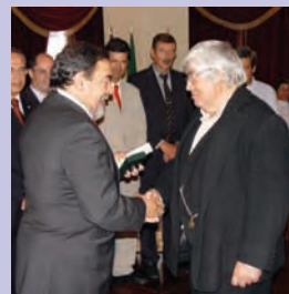
Rancho Etnográfico de Danças e Cantares da Barra Cheia